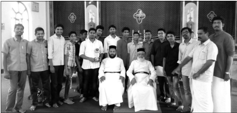
പഠനാടി ഡിസ്ട്രിക്ട് ബെസ്റ്റ് യൂണിറ്റ് അവാർഡുമായി കോത്തല യുവജനപ്രസ്ഥാനം പ്രവർത്തകർ