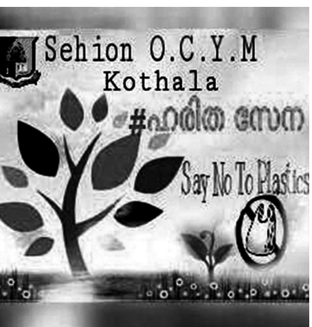
അണി ചേരാം ഹരിതസേനയിൽ മാലിന്യമില്ലാത്ത ഒരു സമൂഹത്തിനായി...