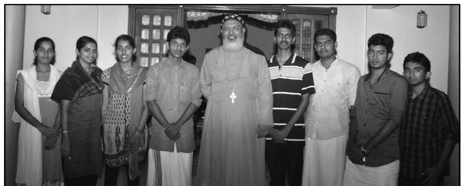
പ്രദക്ഷിണം ടീം മെത്രാപ്പോലീത്തായ്ക്കൊപ്പം