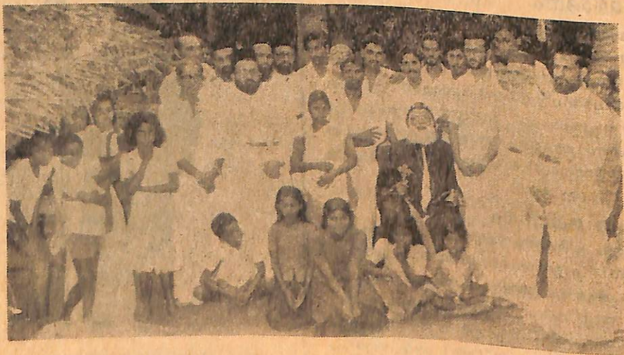
ഓർത്തഡോക്സ് യുവജനപ്രസ്ഥാനം കൊല്ലം ലിറ്ററേച്ചറൽ സെന്ററിന്റെ ആഭിമുഖ്യത്തിൽ മാവേലിക്കര പുതിയകാവ് യൂണിവേഴ്സിറ്റിയിൽ സഹകരണത്തോടെ കൂടി നിർമ്മിക്കുന്ന വീടിന്റെ കല്ലിടി കർമ്മം നിർവ്വഹിച്ചശേഷം പ്രസിഡന്റ് തിരുമേനിയുടെ പ്രവർത്തനങ്ങളെപ്പറ്റി.