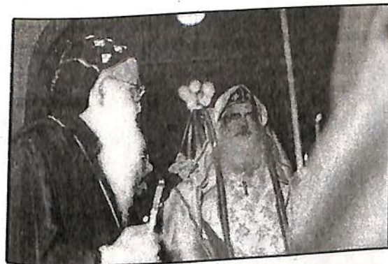
നിയുക്ത കാതോലിക്ക കഥാപുരുഷന്റെ ഭൗതിക ശരീരത്തിനു മുമ്പിൽ