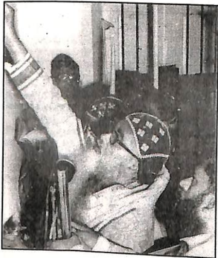
“ബാറെക് ഉകാദേശ്.....” ദേവാലയത്തിന്റെ കിഴക്കേ ഭിത്തി മുദ്രണം ചെയ്യുന്നു.