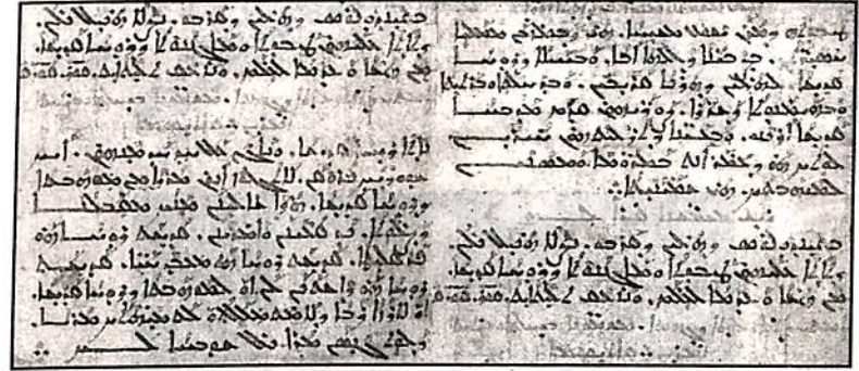
കഥാപുരുഷന്റെ സുറിയാനി കൈയെഴുത്ത്