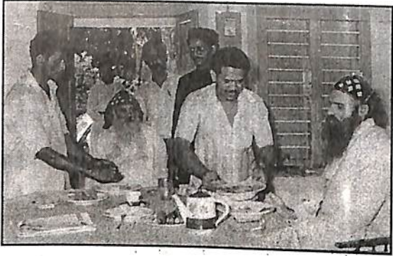
മെത്രാസന വിഭജനത്തിന് ശേഷം കുന്നംകുളത്തിന്റെ പൗലൂസ് മാർ മിലിത്തിയോസ് മെത്രാപ്പോലീത്തായു മൊത്ത്