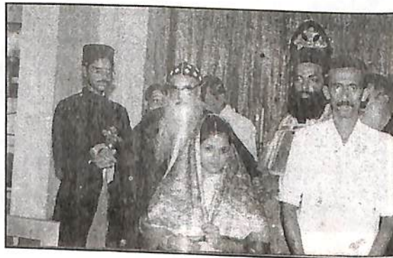
കഥാപുരുഷൻ നടത്തിയ അവസാനത്തെ വിവാഹ കുദാശ