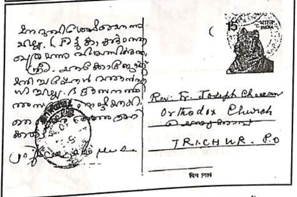
കഥാപുരുഷന്റെ മലയാളം കൈയെഴുത്ത്