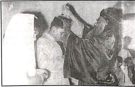
കഥാപുരുഷൻ ഗ്രന്ഥകർത്താവിന്റെ വിവാഹ കുദാശയിൽ