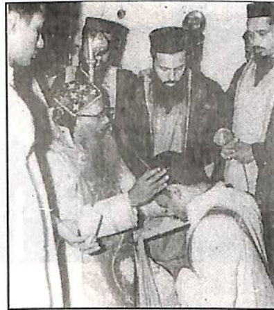
“മെസ്ത്താപ്പാർ കാദേശോദേ.....” ഗ്രന്ഥകർത്താവിന് പഴഞ്ഞിപ്പള്ളി യിൽ കാശീശാപ്പട്ടം നൽകുന്നു.