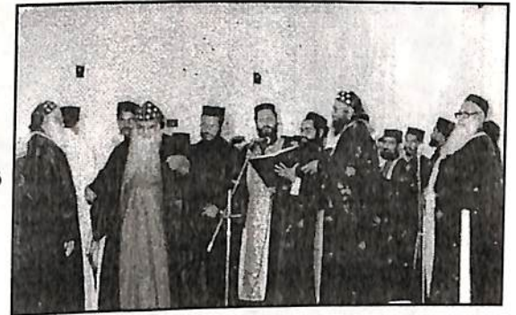
പുതുക്കിപ്പണിത കൊരട്ടി അരമന ചാപ്പലിന്റെ കുദാശ. പ്രധാനഭാഗങ്ങൾക്കു ശേഷം കഥാപുരുഷൻ “അവസാനമായി” മദബഹായോട് വിടചൊല്ലുന്നു